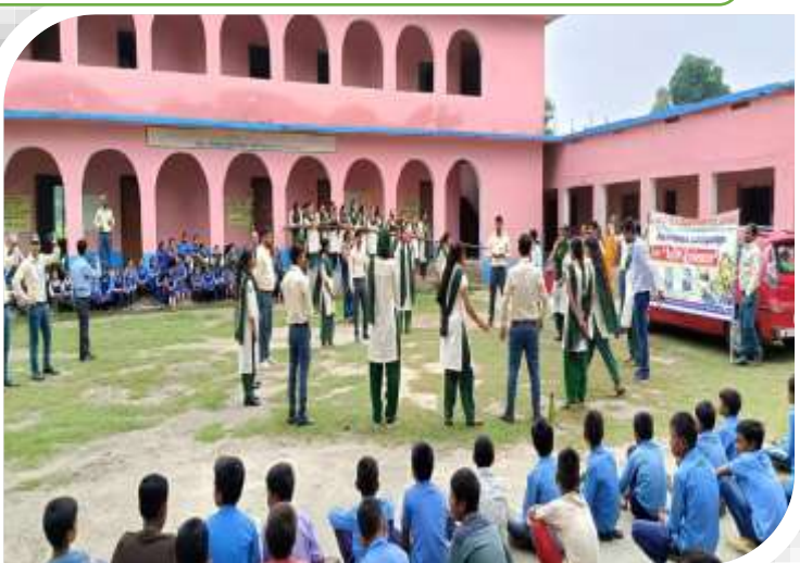
Students performing a play