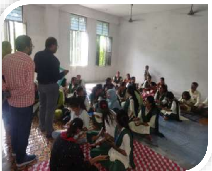
BMTTC, Motihari Organize Mehndi Competition for Girls Student